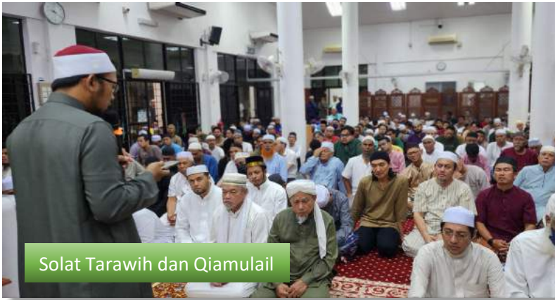
Solat Tarawih dan Qiamulail