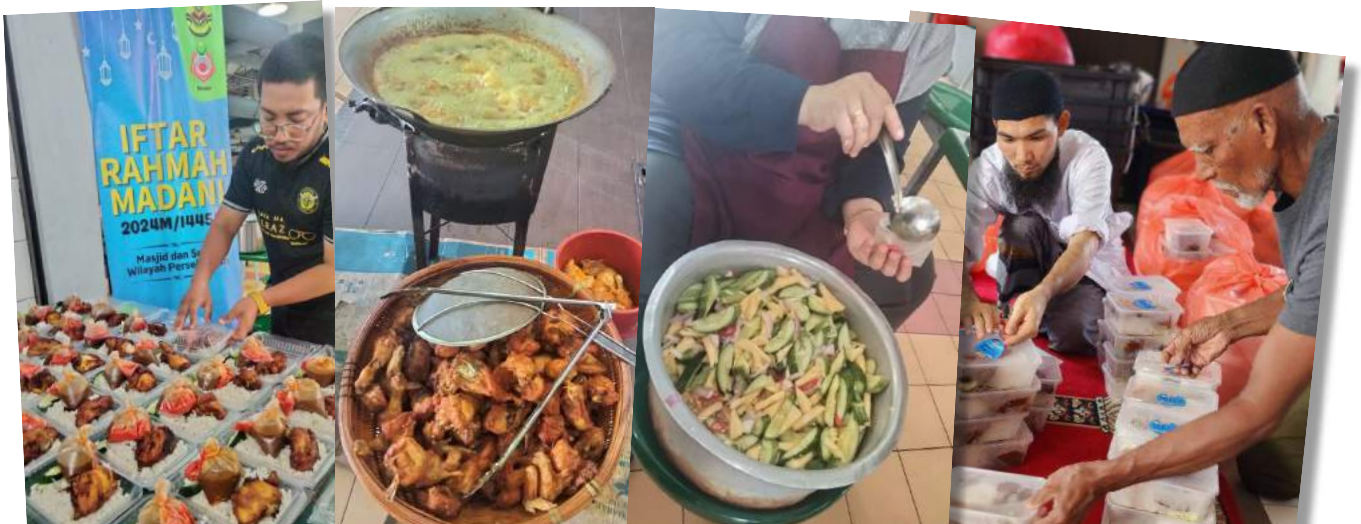
Edaran juadah Iftar 'Iftar Rahmah Madani'