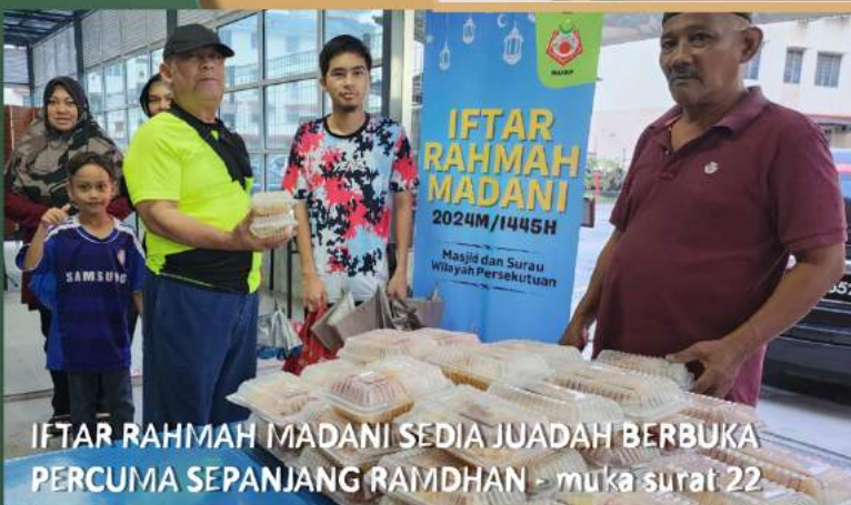
IFTAR RAHMAH MADANI SEDIA JUADAH BERBUKA PERCUMA SEPANJANG RAMDHAN - muka surat 22