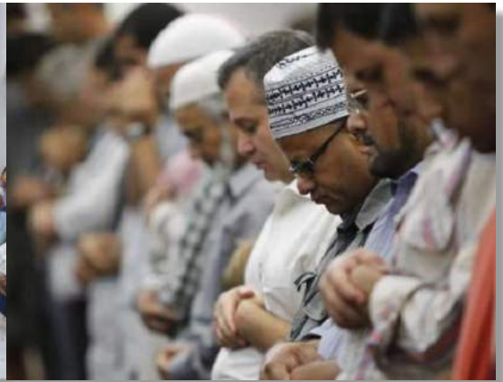
Solat Tarawih 1 Ramadhan menyaksikan seramai hampir 600 jemaah memenuhi ruang solat utama, muslimat dan koridor masjid