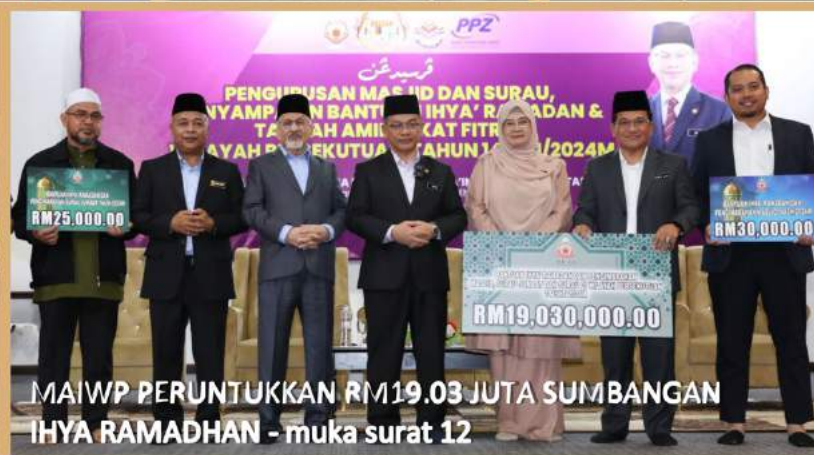
MAIWP PERUNTUKKAN RM19.03 JUTA SUMBANGAN IHYA RAMADHAN - muka surat 12