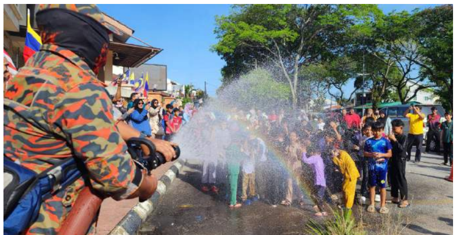
Para peserta disirami air dari Jabatan Bomba dan Penyelamat menambah kemeriahan majlis. - foto BPP

Seramai hampir 50 kanak-kanak berusia antara 5 hingga 12 tahun selamat dikhatankan dengan bantuan tujuh doktor serta dibantu lebih 5 jururawat. Program berakhir pada jam 4.30 petang. - Sumber BPD