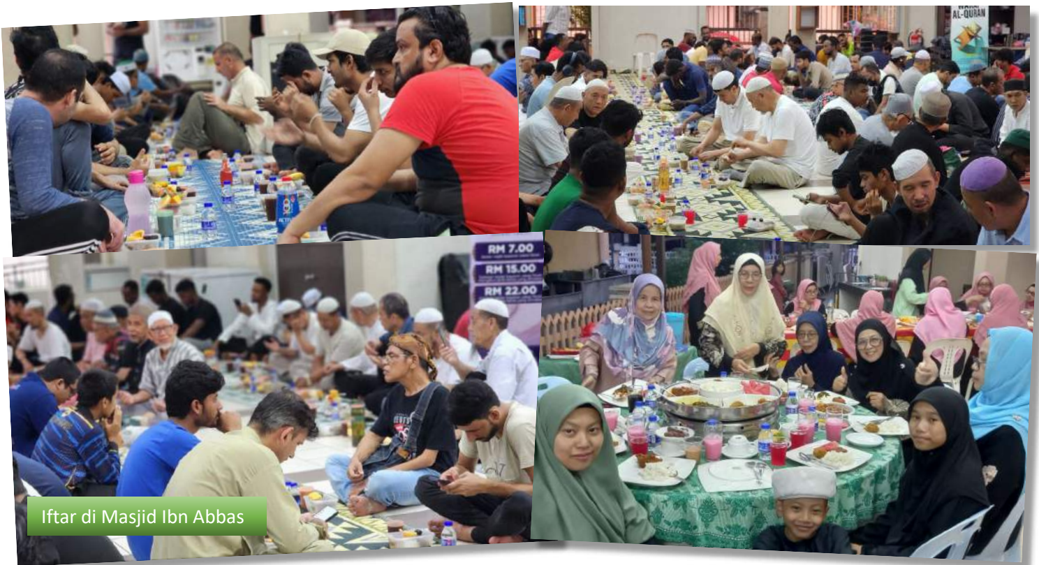
Iftar di Masjid Ibn Abbas

Majlis Iftar di Masjid Ibn Abbas sepanjang Ramadhan yang sentiasa dipenuhi para jemaah berbilang bangsa