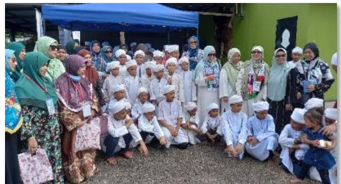
Bersama anak-anak Tahfiz di Maahad Tahfiz An-Nur