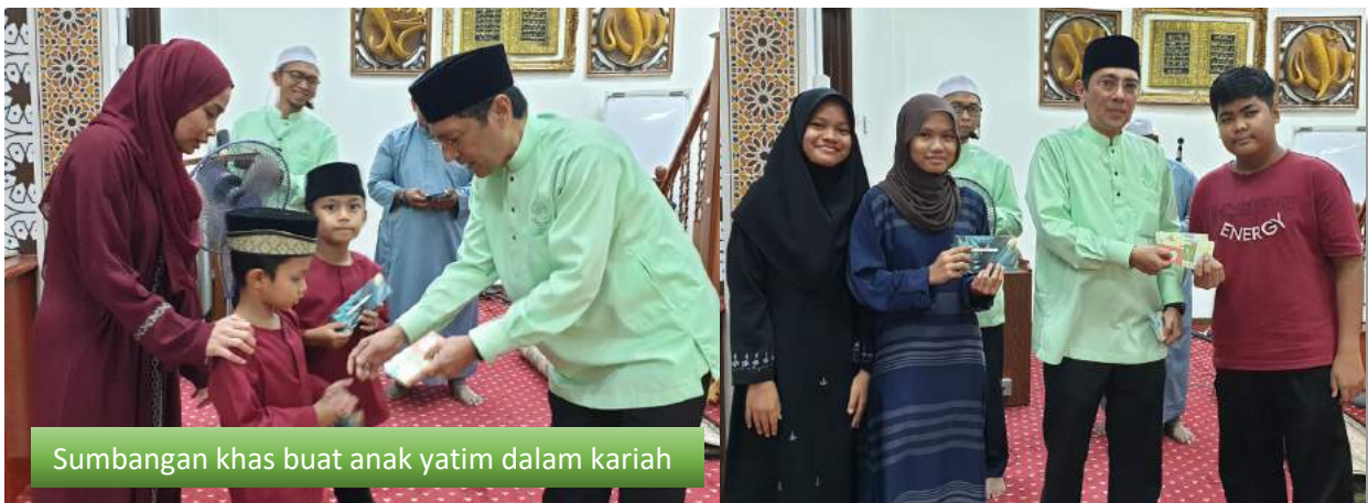
Sumbangan khas buat anak yatim dalam kariah

Penyediaan Bubur Lambuk istimewa antara juadah tahunan yang menjadi tarikan di Masjid Ibn Abbas