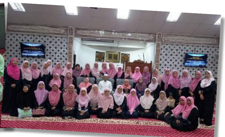
Kumpulan tadarus Al-Quran muslimin dan muslimat sepanjang bulan Ramadhan 1445H