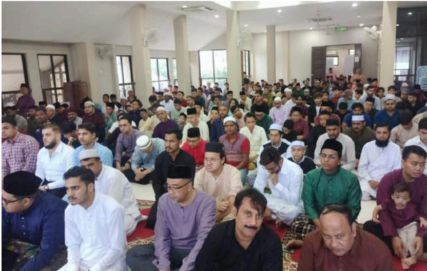
Kehadiran melebihi 1000 jemaah memenuhi masjid menyempurnakan solat sunat Aidilfitri