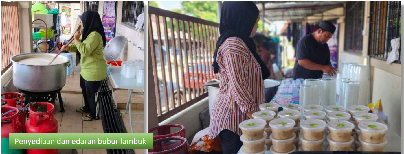
Penyediaan dan edaran bubur lambuk

Majlis Iftar di Masjid Ibn Abbas sepanjang Ramadhan yang sentiasa dipenuhi para jemaah berbilang bangsa