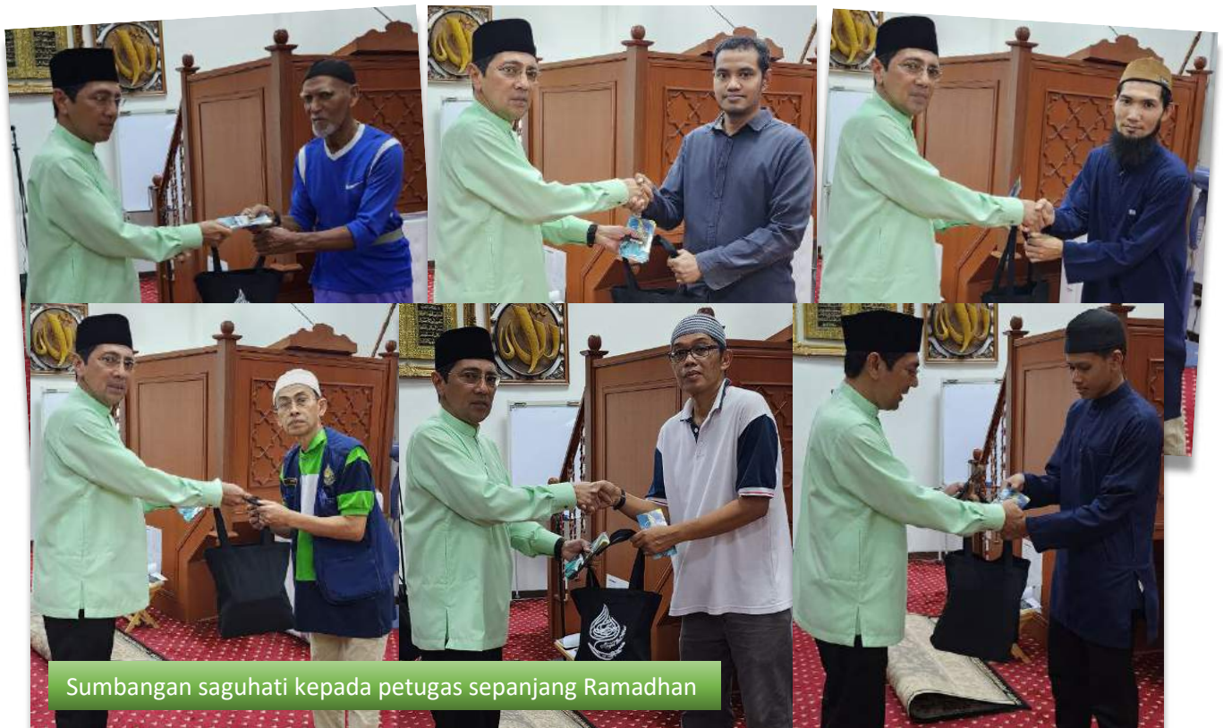
Sumbangan suguhati kepada petugas sepanjang Ramadhan

Sumbangan zakat dan barangan keperluan dapur kepada asnaf dan mualaf seramai 25 orang dalam kariah