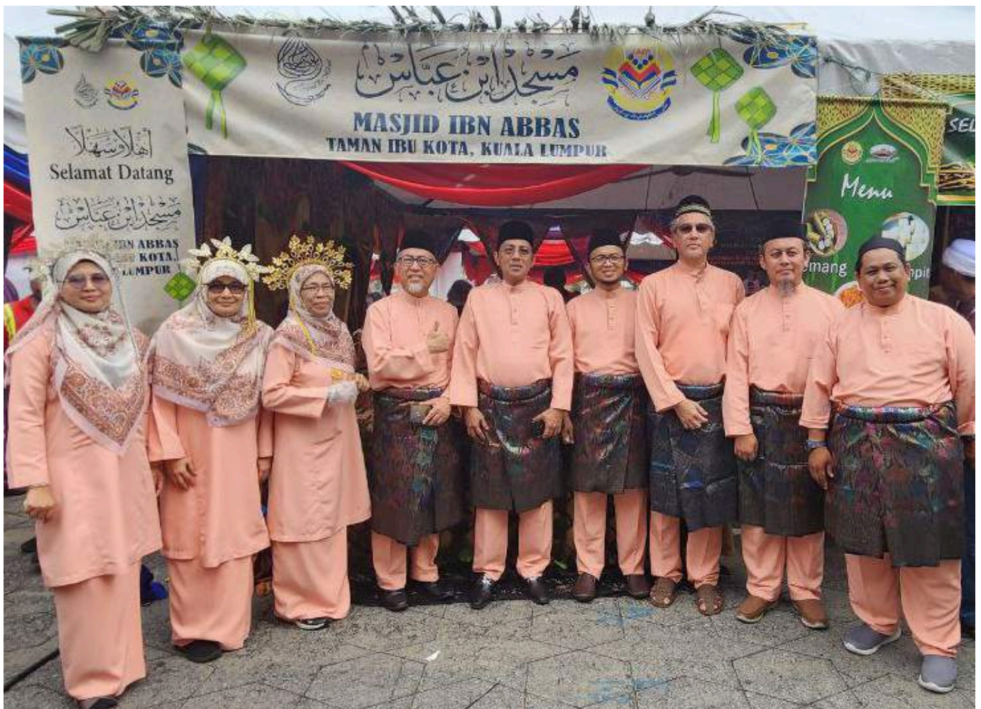
Barisan Jawatankuasa Masjid Ibn Abbas yang terlibat dalam menjayakan Majlis Ramah Mesra Masjid dan Surau Jumaat Wilayah Persekutuan.