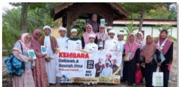
Bersama para Tahfiz di Kompleks Islam Darul Faizin