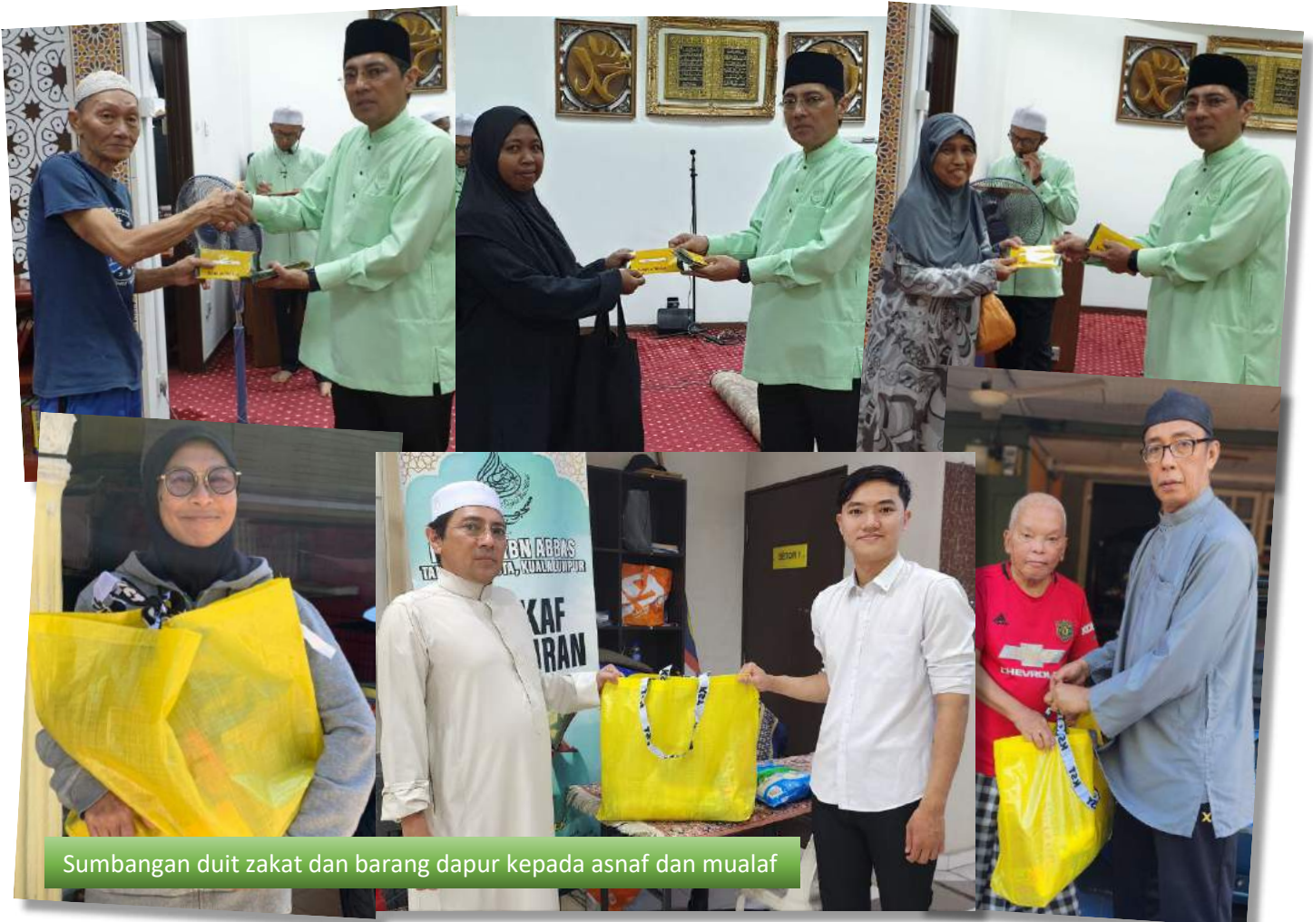
Sumbangan duit zakat dan barang dapur kepada asnaf dan mualaf

Sumbangan zakat dan barangan keperluan dapur kepada asnaf dan mualaf seramai 25 orang dalam kariah